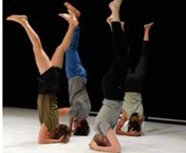
Danse contemporaine aux Quinconces.

Votre guide sera Lauréna Salion Plein tarif : 3 € / tarif réduit : 2 € Billetterie : Maison du Pilier-Rouge. Départ : 16h15, Maison du Pilier-Rouge