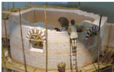
Maquette de l'enceinte romaine, exposée au musée Jean-Claude Boulard-Carré Plantagenêt.