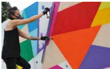
L'artiste de street art Stoul pendant le festival Plein Champ Off dédié à l'art urbain.