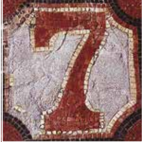
Le célèbre numéro 7 d'une maison close de la rue des Pans de Gorrion.