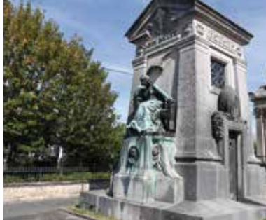
Chapelle Léon Bollée au cimetière Sainte-Croix.