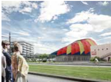
Projet du chapiteau permanent de la Cité du cirque Marcel Marceau © Christophe Theilmann.