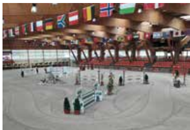
Pôle européen du cheval.